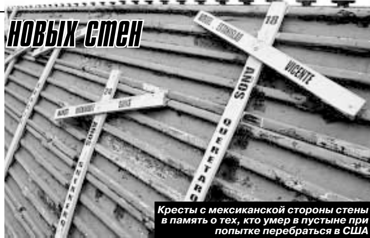
Кресты с мексиканской стороны стены в память о тех, кто умер в пустыне при попытке перебраться в США

Напомним, что 26 октября президент США Джордж Буш подписал закон о возведении дополнительных оградительных сооружений на участке границы с Мексикой длиной в 1100 километров. «К сожалению, США в